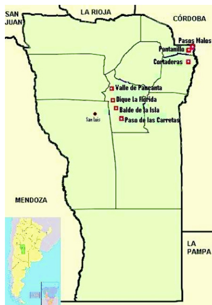
Figura 2.- Poblaciones silvestres coleccionadas en la provincia de San Luis

San Luis: Dique La Florida, Balde de la Isla, Valle de Pancanta, El Pantanillo (Merlo), Cortaderas, Dique del Paso de las Carretas y Pasos Malos (Figura 2). De cada población se muestrearon entre 30 y 50 plantas y se secaron a la sombra durante varios días, hasta un contenido de humedad del 12 al 15%. Las colectas de cinco poblaciones se repitieron en distintas épocas del año: noviembre/diciembre 2006-2007 y marzo 2007-2008. Las colectas de noviembre/diciembre correspondieron a material vegetal en comienzos a 50% de floración, mientras que los materiales de marzo correspondieron a materiales en plena floración ó posfloración. El ejemplar de herbario fue depositado en el herbario del Instituto de Recursos Biológicos, INTA Castelar (Molina A. M. 6757).