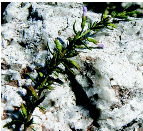
Figura 1.- Detalle de rama florífera de Hedeoma multiflora

En la Argentina, las provincias de San Luis y Córdoba concitan especial atención por su riqueza