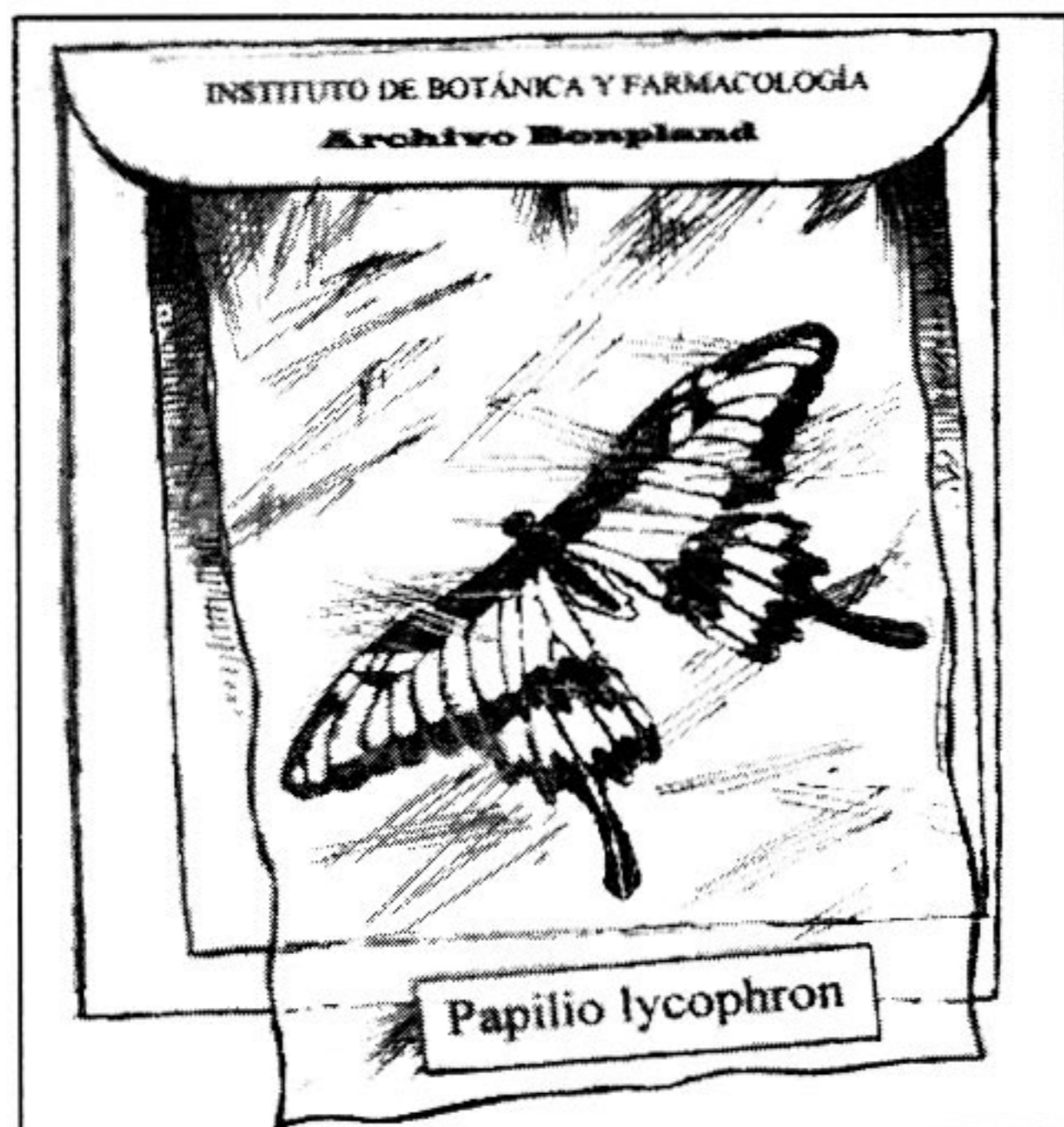
Fig. 1. Ejemplar montado sobre soporte de cartón, con elevada acidez; protegido por celofán. El conjunto presentaba un marcado índice de deterioro.

4. Identificación . Se numeró e identificó cada carpeta en la parte exterior con lápiz.